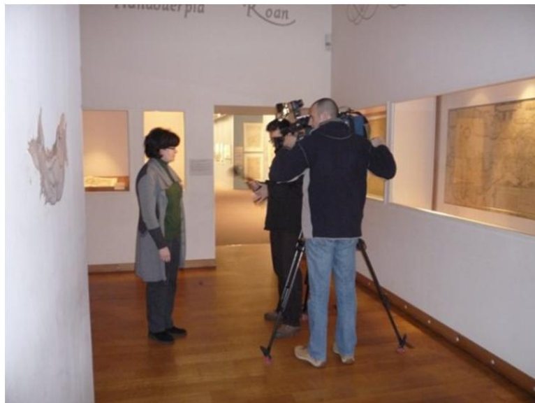
De filmploeg van de RTBF op bezoek in het Mercatormuseum

Tussen de voorbereidingen voor de opnames van de BBC door, kreeg het SteM nog een telefoontje. Deze keer van RTBF, met de vraag of ze mogen komen filmen voor hun uitzending Au Quotidien van diezelfde avond. Wie was Mercator nu eigenlijk? Onze collectie, het Mercatormuseum en de stad Sint Niklaas kwamen diezelfde avond reeds aan bod op de Franstalige televisiezender RTBF. Het filmpje is te bekijken via een link op de homepage van onze webstek ( www.kokw.be ).